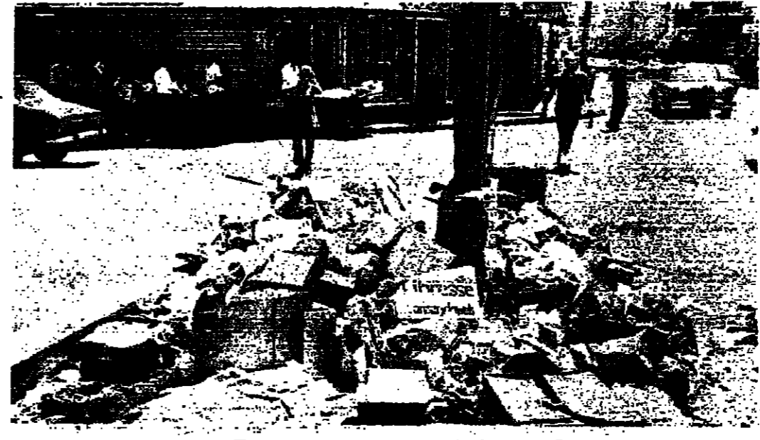
كسور من التفتيات في شارع الحمراء